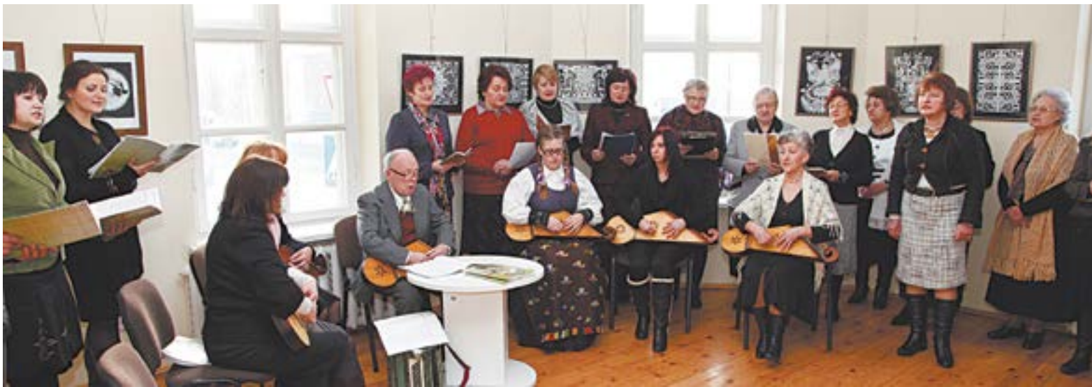
Susirinko ir jubiliečio kūrybos dainas atliko ansamblis, kuriame – ir ankstesnių, ir dabar jo vadovaujamų kolektyvų nariai, ir jo darbą vertinantieji...

Nijolė LINIONIENĖ